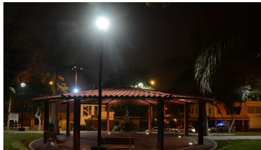
Parque N° 01 – Los Girasoles