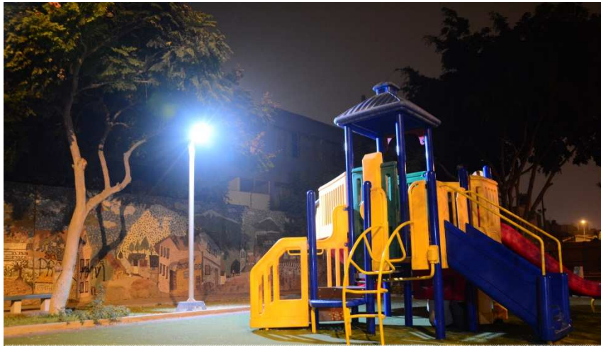
Parque A. Von Humboldt