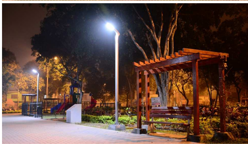
Parque Perú - Bolivia