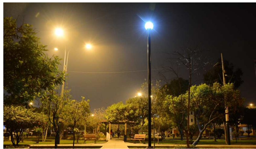
Parque Principal APROVISA