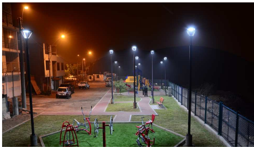
Pq. N° 1 – Hijos de Constructores