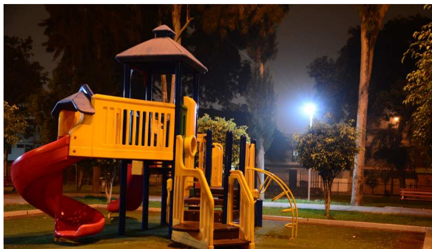
Parque Virgen de la Asunción