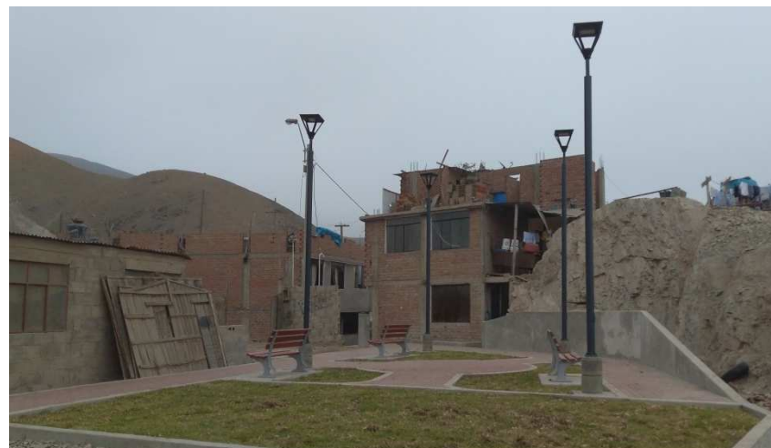
Pq. N° 2 – Hijos de Constructores