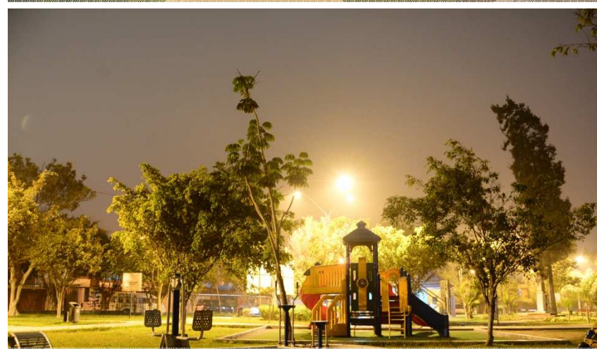
Parque J. C. Mariátegui - COVIMA