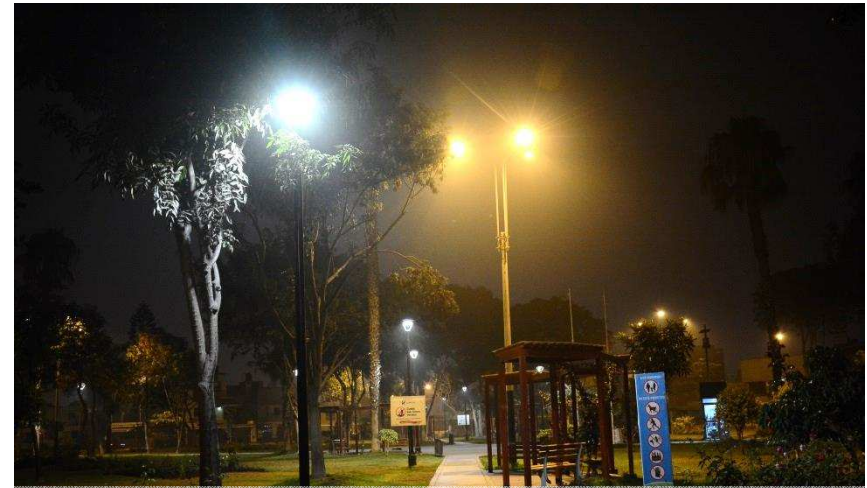
Parque Cristo Reconciliador