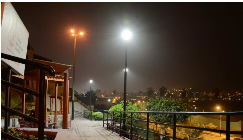
Parque El Mástil – C.C. Lagunas